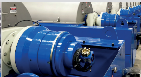
Increased decanter performance and improved separation results thanks to the hydrostatic ROTODIFF drive. Erhöhte Dekanter-Leistung und verbesserte Trennergebnisse dank dem hydrostatischen ROTODIFF Antrieb.