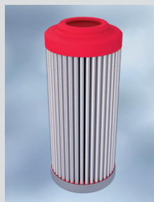
Elastic system for the manufacture of end caps / Elastisches System zur Herstellung der Endkappen