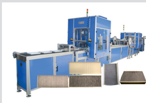
Cabin Filter Line Innenraumfilterlinien

Innenraumfilterlinien, Luftfilterproduktionslinien, Minipleat-Linien, Plisseefilterlinien, Rotations-Faltlinien, Ölfilterlinien, Spulenfilterlinien, Streckmetalllinien, HEPA-Filterlinien, Montagezellen